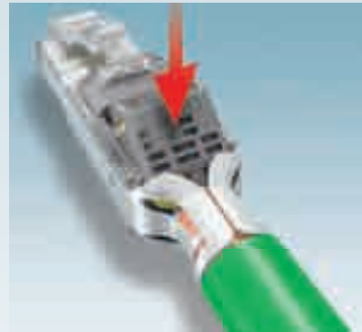
3. Cerrar las tapas de conexión – Listo.