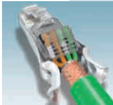
2. Cortar los conductores al ras