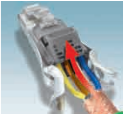
1. Introducir los conductores